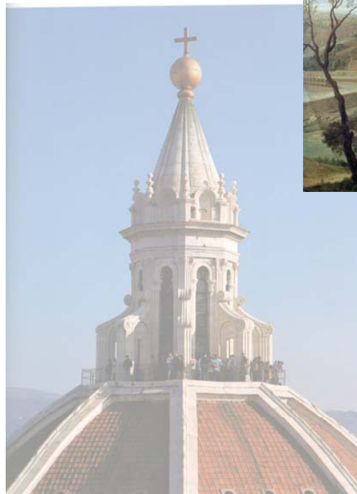
Dôme – cathédrale Santa Maria del Fiore - Florence