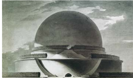
Etienne Louis Boulée - Sphère dédiée à Newton